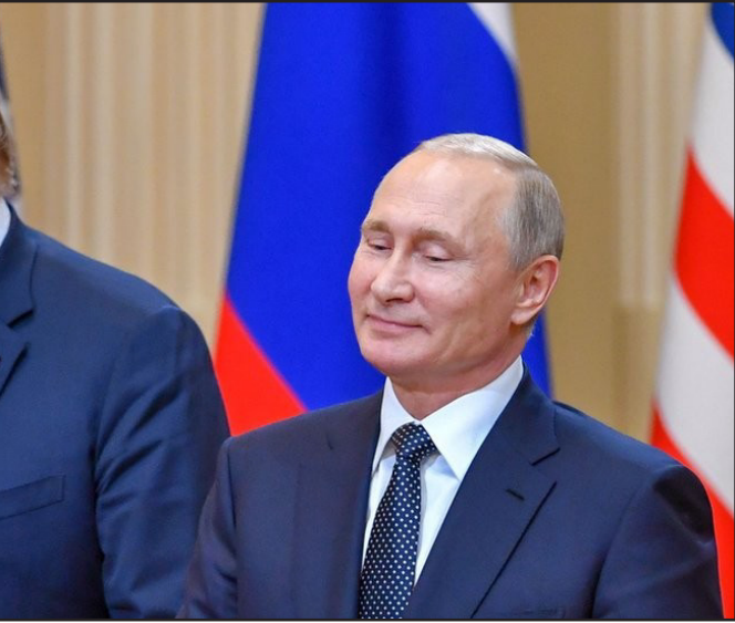
ਹਥਿਆਰਾਂ ਦੀ ਗਿਣਤੀ 'ਤੇ ਰੋਕ ਖ਼ਤਮ, ਤਿੰਨ-ਪੱਖੀ ਜੰਗ ਦਾ ਡਰ: ਸੰਧੀ ਖ਼ਤਮ ਹੋਣ ਨਾਲ ਦੋਵੇਂ ਪਾਸੇ 35 ਸਾਲਾਂ 'ਚ ਪਹਿਲੀ ਵਾਰ ਪ੍ਰਮਾਣੂ ਹਥਿਆਰਾਂ ਦੀ ਤਾਇਨਾਤੀ ਵਧਾ ਸਕਦੇ ਹਨ। ਹੁਣ ਇਹ ਮੁਕਾਬਲਾ ਸਿਰਫ ਅਮਰੀਕਾ ਅਤੇ ਰੂਸ ਵਿਚਕਾਰ ਨਹੀਂ ਸਗੋਂ ਚੀਨ ਨੂੰ ਵੀ ਸ਼ਾਮਲ ਕਰ ਸਕਦਾ ਹੈ ਜੋ ਤੇਜ਼ੀ ਨਾਲ ਆਪਣੇ ਪ੍ਰਮਾਣੂ ਭੰਡਾਰ ਵਧਾ ਰਿਹਾ ਹੈ। ਹਥਿਆਰਾਂ 'ਤੇ ਪਾਬੰਦੀ ਨਾ ਹੋਣ ਕਾਰਨ ਦੋਵੇਂ ਦੇਸ਼ ਬੁਰੇ ਹਾਲਾਤ ਦੀ ਤਿਆਰੀ ਵਜੋਂ ਆਪਣੀ ਤਾਕਤ ਵਧਾਉਣਗੇ ਜਿਸ ਨਾਲ ਗਲੋਬਲ ਅਸਥਿਰਤਾ ਵਧੇਗੀ। ਪੁਤਿਨ ਤੇ ਟਰੰਪ ਦਾ ਰੁਖ਼: ਰੂਸੀ ਰਾਸ਼ਟਰਪਤੀ ਵਲਾਦੀਮੀਰ ਪੁਤਿਨ ਨੇ ਸੰਧੀ ਨੂੰ ਇੱਕ ਸਾਲ ਲਈ ਵਧਾਉਣ ਦੀ ਇੱਛਾ ਜ਼ਾਹਿਰ ਕੀਤੀ ਸੀ ਬਸ਼ਰਤ ਅਮਰੀਕਾ ਵੀ ਸਹਿਮਤ ਹੋਵੇ। ਹਾਲਾਂਕਿ ਅਮਰੀਕੀ ਰਾਸ਼ਟਰਪਤੀ ਡੋਨਲਡ ਟਰੰਪ ਨੇ ਅਜੇ ਤਕ ਇਸ 'ਤੇ ਕੋਈ ਪੱਕਾ ਫ਼ੈਸਲਾ ਨਹੀਂ ਲਿਆ। ਵਾਈਟ ਹਾਊਸ

ਮੌਸਕੋ: ਦੁਨੀਆਂ ਦੇ ਦੋ ਸਭ ਤੋਂ ਸ਼ਕਤੀਸ਼ਾਲੀ ਦੇਸ਼ਾਂ ਅਮਰੀਕਾ ਤੇ ਰੂਸ ਵਿਚਕਾਰ ਪ੍ਰਮਾਣੂ ਹਥਿਆਰਾਂ ਨੂੰ ਕੰਟਰੋਲ ਕਰਨ ਵਾਲੀ ਆਖਰੀ ਬਾਕੀ ਬਚੀ ਸੰਧੀ ਨਿਊ ਸਟਾਰਟ (New Start) ਇਸ ਹਫ਼ਤੇ ਵੀਰਵਾਰ ਨੂੰ ਖਤਮ ਹੋ ਗਿਆ ਹੈ। ਪਿਛਲੀ ਅੱਧੀ ਸਦੀ 'ਚ ਇਹ ਪਹਿਲੀ ਵਾਰ ਹੋਵੇਗਾ ਜਦੋਂ ਦੁਨੀਆਂ ਦੇ ਦੋ ਸਭ ਤੋਂ ਵੱਡੇ ਪ੍ਰਮਾਣੂ ਭੰਡਾਰਾਂ 'ਤੇ ਕਿਸੇ ਵੀ ਤਰ੍ਹਾਂ ਦੀ ਕੋਈ ਕਾਨੂੰਨੀ ਪਾਬੰਦੀ ਨਹੀਂ ਹੋਵੇਗੀ। ਮਾਹਿਰਾਂ ਨੇ ਚਿਤਾਵਨੀ ਦਿੱਤੀ ਹੈ ਕਿ ਇਸ ਨਾਲ ਇੱਕ ਬੋਲਗਾਮ ਪ੍ਰਮਾਣੂ ਹਥਿਆਰਾਂ ਦੀ ਦੌੜ ਸ਼ੁਰੂ ਹੋ ਸਕਦੀ ਹੈ।