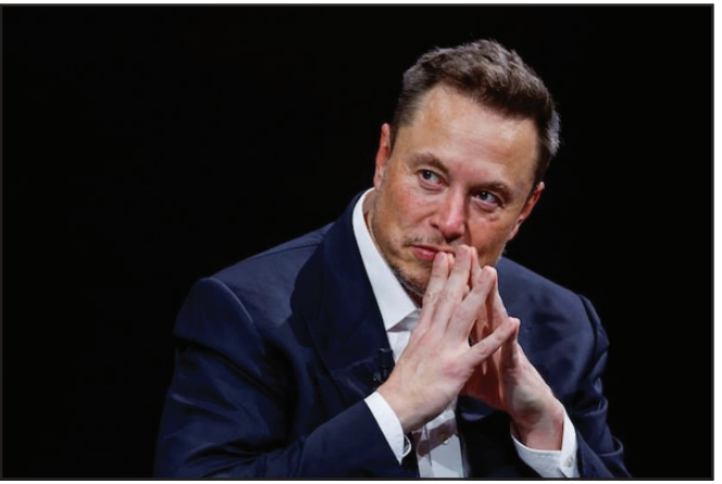
ਫੋਰਬਜ਼ ਅਨੁਸਾਰ, ਨਾਲ ਦੋਵਾਂ ਕੰਪਨੀਆਂ ਦਾ ਸਪੇਸਐੱਕਸ ਅਤੇ X AI ਦੇ ਰਲੇਵੇਂ ਸੰਯੁਕਤ ਮੁੱਲ ਲਗਭਗ 1.25

ਨਿਊ ਯੋਰਕ: ਟੈੱਸਲਾ ਦੇ ਮਾਲਕ ਅਤੇ ਵਿਸ਼ਵ-ਪ੍ਰਸਿੱਧ ਉਦਯੋਗਪਤੀ ਈਲੋਨ ਮਸਕ ਨੇ ਇੱਕ ਵਾਰ ਫਿਰ ਇਤਿਹਾਸ ਰਚਿਆ ਹੈ। ਏਅਰਸਪੇਸ ਕੰਪਨੀ ਸਪੇਸਐੱਕਸ ਦੁਆਰਾ ਆਪਣੀ ਆਰਟੀਫੀਸ਼ੀਅਲ ਇੰਟੈਲੀਜੈਂਸ ਅਤੇ ਸੋਸ਼ਲ ਮੀਡੀਆ ਫਰਮ X AI ਨੂੰ ਪ੍ਰਾਪਤ ਕਰਨ ਤੋਂ ਬਾਅਦ ਮਸਕ ਦੀ ਦੌਲਤ 'ਚ ਭਾਰੀ ਵਾਧਾ ਹੋਇਆ ਹੈ। ਉਸ ਦੀ ਕੁੱਲ ਜਾਇਦਾਦ ਹੁਣ $800 ਬਿਲੀਅਨ ਨੂੰ ਪਾਰ ਕਰ ਗਈ ਹੈ ਜਿਸ ਨਾਲ ਉਹ ਦੁਨੀਆਂ ਦਾ ਸਭ ਤੋਂ ਅਮੀਰ ਵਿਅਕਤੀ ਬਣ ਗਿਆ ਹੈ।